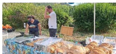
La Ferme des Aiguilles