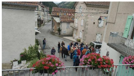
A travers le village, puis à l'église Saint Blaise