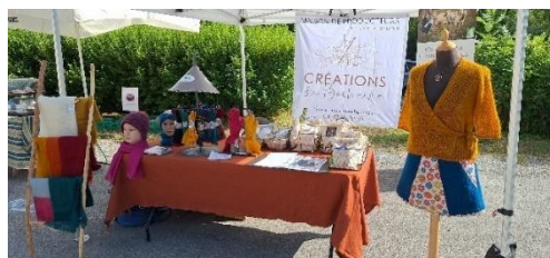
Les Créations du Bochaîne