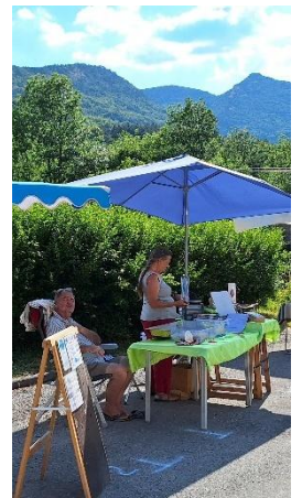
Jasmine : cookies