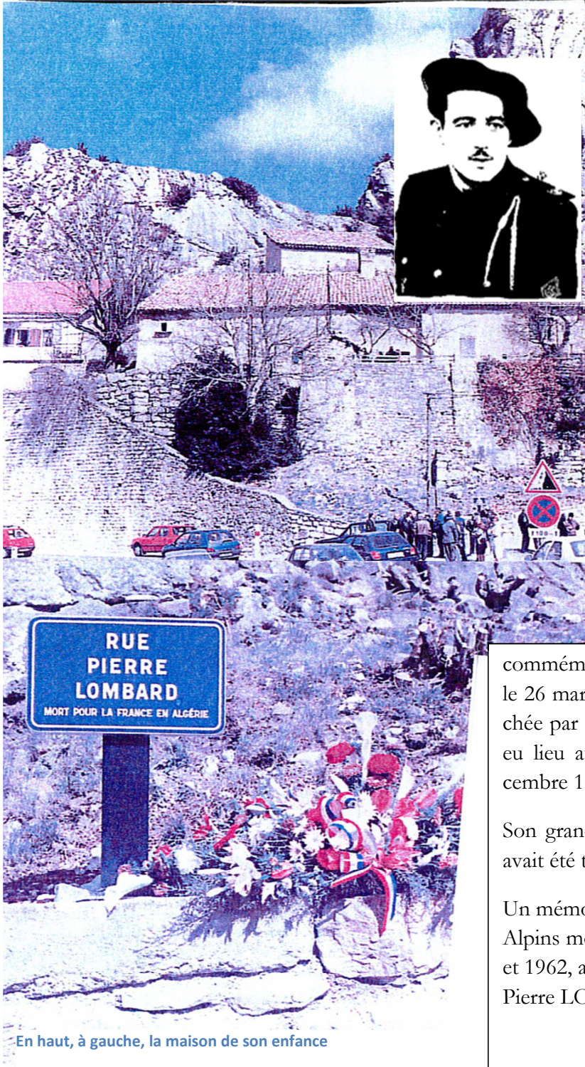
En haut, à gauche, la maison de son enfance