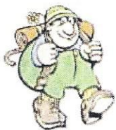
Espace Randonnée des Pays du Buëch

L'Espace Randonnée des Pays du Buëch, syndicat mixte créé en octobre 1999, rassemble cinq communautés de communes du Buëch autour d'un objectif commun : aménager, animer et promouvoir les activités de randonnées non motorisées : pédestre, cyclotourisme, VTT et équestre, à des fins de développement local et touristique.