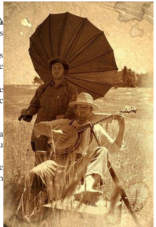
Sam de Babel Buëch Madam', pour Couleurs Sépia.

Pour cela et pour le reste, vous êtes, évidemment, attendus. D'ici là portez-vous bien, madame, et bonjour à monsieur !