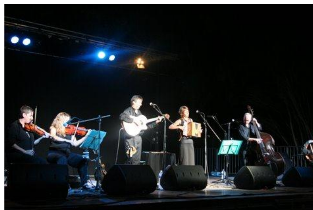
Groupe Irish Coffee

15 décembre : spectacle et goûter de Noël.